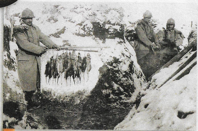
6 Les rats dans les tranchées

Lettre d'un poilu datée du 28 novembre 1914.