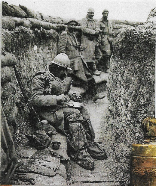
3 La «soupe» du poilu

Les soldats français sont appelés les «poilus». Le manque d'eau et la saleté provoquent des maladies. Les rats transmettent des puces, entraînant démangeaisons et maladies.