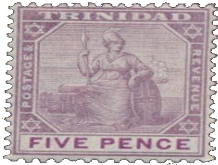
« Le five pence of Trinidad »