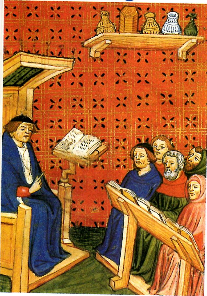
1 L'enseignement religieux