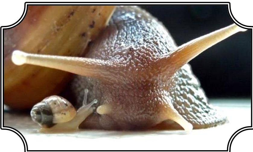
Escargot et bébé escargot