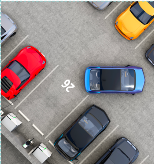
Je me gare.