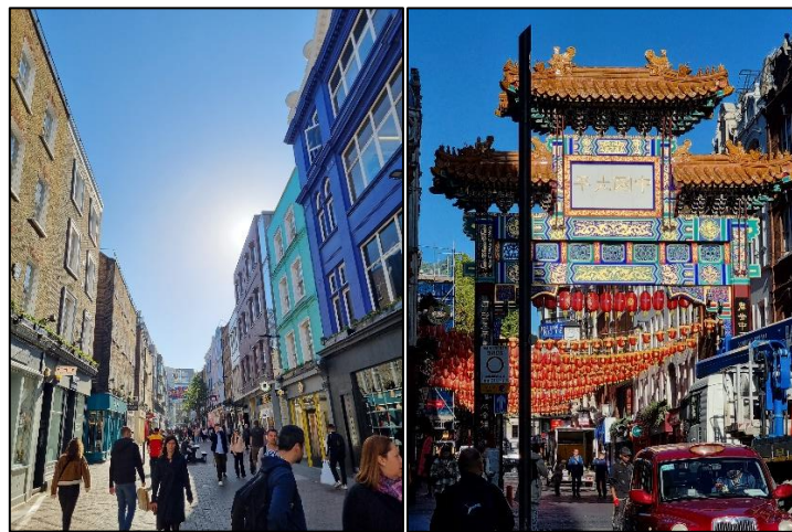
Certaines rues sont de toutes les couleurs