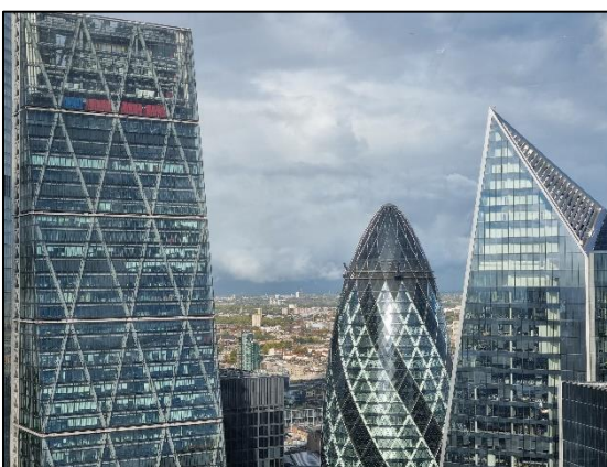
La city vu de haut