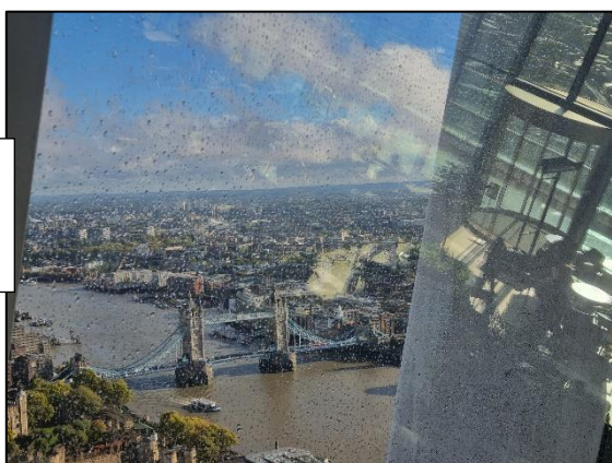
TOWER BRIDGE vu de haut