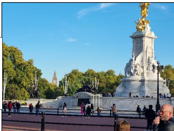
Vu de Big Ben depuis Buckingham Palace