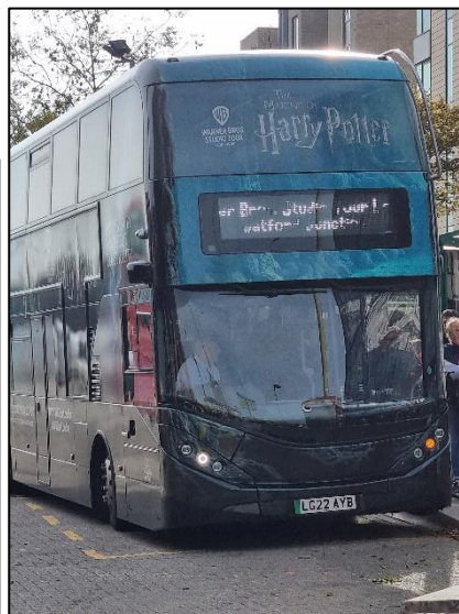
DOUBLE DECKER pour se rendre au studio WARNER