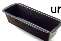
un moule à cake