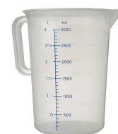
un verre doseur