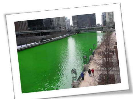
La « Chicago River » est teinte en vert tous les ans à l'occasion de la Saint-Patrick.