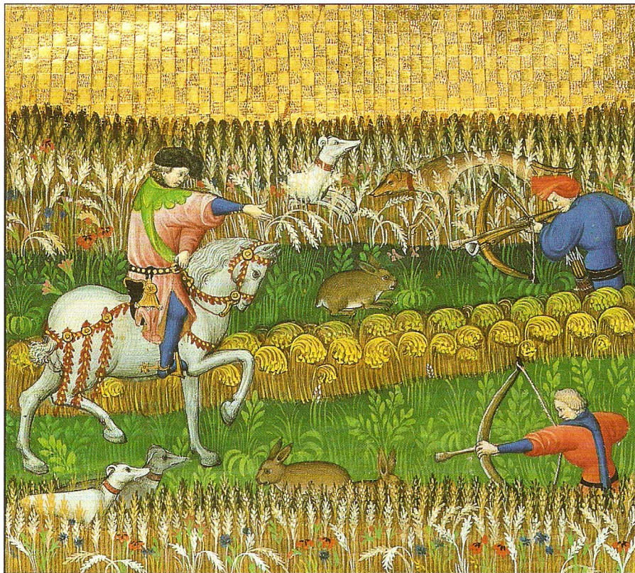
La chasse au lièvre dans un champ de céréales, miniature du Livre de la chasse , vers 1450, Bibliothèque nationale de France.

Au XIII e siècle, Guillaume de Nangis, moine de l'abbaye de Saint-Denis, écrit la vie du roi Saint Louis et de son fils Philippe III. Il loue ici la justice du roi Louis en racontant l'histoire du seigneur de Coucy.