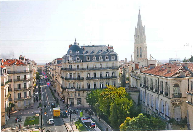
Document 1 : Le quartier du centre de Montpellier.