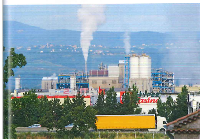
Document 5 : Un quartier industriel.

6. Que vois-tu le plus comme bâtiments dans ce quartier ?