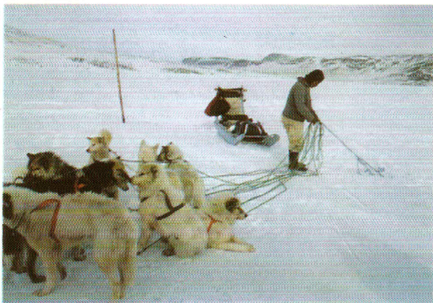
Quand vous voyez des esquimaux (ci-dessus) ou des ours blancs, vous êtes en pays arctique.

inlandsis. Au Sud, le pôle est au cœur d'un continent isolé, l'Antarctique, 25 fois plus vaste que la France.