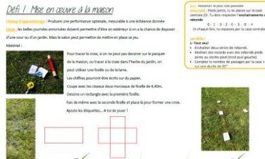
Cette fiche est sur le site:

Conseil: réalise la croix avec une craie sur une surface plane. Attention à garder les pieds joints et à ne pas se tordre la cheville. Tu peux défier les personnes autour de toi (frères, sœurs, parents,...).