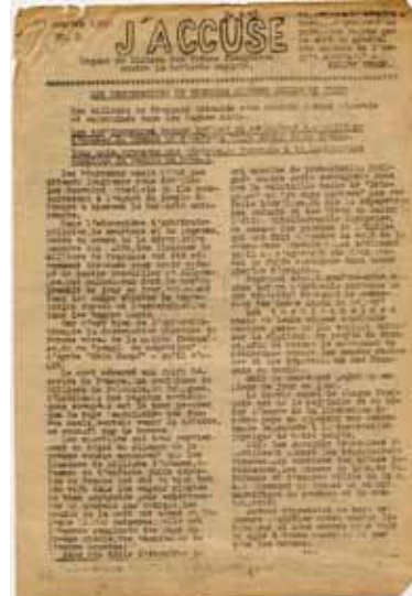
Avec cette feuille clandestine, le Mouvement National contre le Racisme mobilise l'opinion publique pour que se développe l'action des réseaux de sauvetage - octobre 1942

« Pour un enfant, au Noirvault, c'était la liberté. Je me promenais. J'accompagnais les vaches dans les champs. Le matin, c'était de grandes tartines de beurre salé. J'étais aimé par tout le village. »