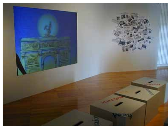
Exposition permanente Centre Régional « Résistance & Liberté »

Recherche documentaire sur l'arrestation d'Ida Grinspan, jeune juive placée dans les Deux-Sèvres en 1940 et déportée en février 1944, à l'âge de 14 ans, vers Auschwitz-Birkenau.