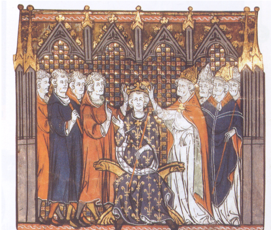
Le sacre d'Hugues Capet, manuscrit du XIV ème siècle