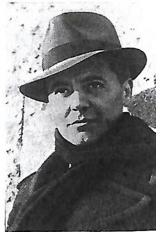
Jean Moulin .