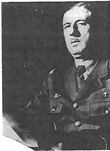
le Général de Gaulle