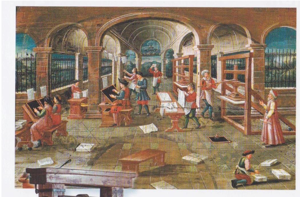
Tableau représentant une imprimerie, XVIIème siècle