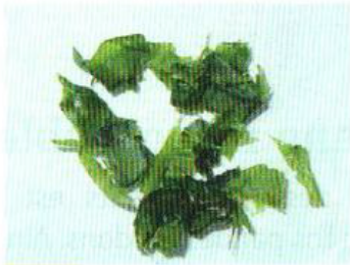
Doc. 3 Aliments mis dans la bouche.