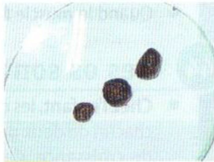
Doc. 6 Contenu du gros intestin.