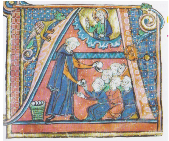
Donner du pain aux pauvres