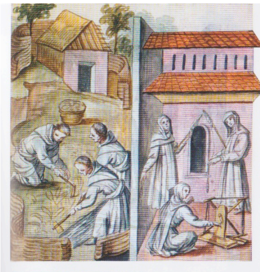
Travailler au champ