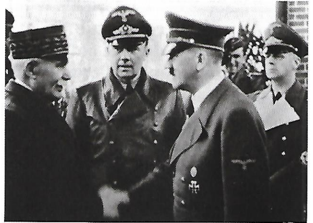
P. Pétain (chef de l'État français) et A. Hitler à Montoire, le 24 octobre 1940.