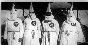
membres du Ku-Klux-Klan

Elle est née en 1913 dans l'Alabama. A cette époque, les Noirs et les Blancs n'ont pas les mêmes droits et il est difficile pour les Noirs de suivre une scolarité. Mais sa mère est institutrice et lui fait l'école à la maison jusqu'à 11 ans. Elle est ensuite envoyée dans une école pour Noirs qui sera brûlée plusieurs fois par le Ku-Klux-Klan (une organisation raciste dont les membres sont très violents avec les gens qui ont la peau noire).