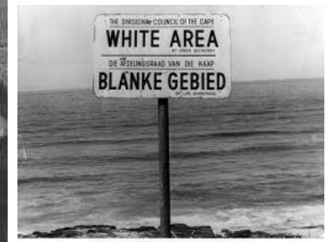
White Area – 1976