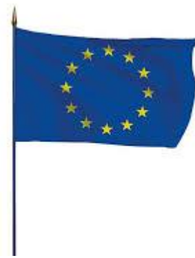
Le drapeau de l'Union européenne

Le traité de Paris a été mis en place après le discours d'un ministre français, Robert Schumann, sur la construction européenne.