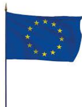
Le drapeau de l'Union européenne

Le traité de Paris a été mis en place après le discours d'un ministre français, Robert Schumann, sur la construction européenne.