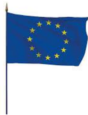
Le drapeau de l'Union européenne

Le traité de Paris a été mis en place après le discours d'un ministre français, Robert Schumann, sur la construction européenne.