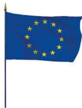
Le drapeau de l'Union européenne

Le traité de Paris a été mis en place après le discours d'un ministre français, Robert Schumann, sur la construction européenne.