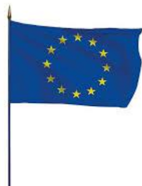
Le drapeau de l'Union européenne

Le traité de Paris a été mis en place après le discours d'un ministre français, Robert Schumann, sur la construction européenne.