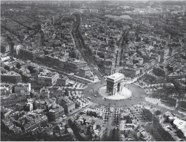
La place de l'Étoile.