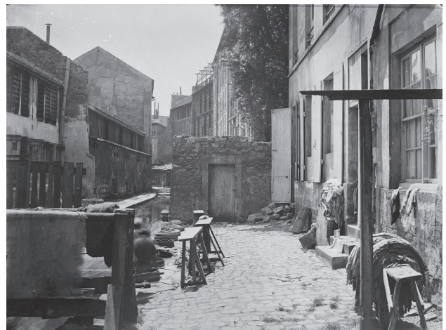
La Brièvre, tanneries et tanneurs, vers 1860.