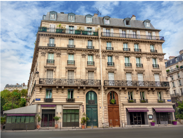
Un immeuble haussmannien.