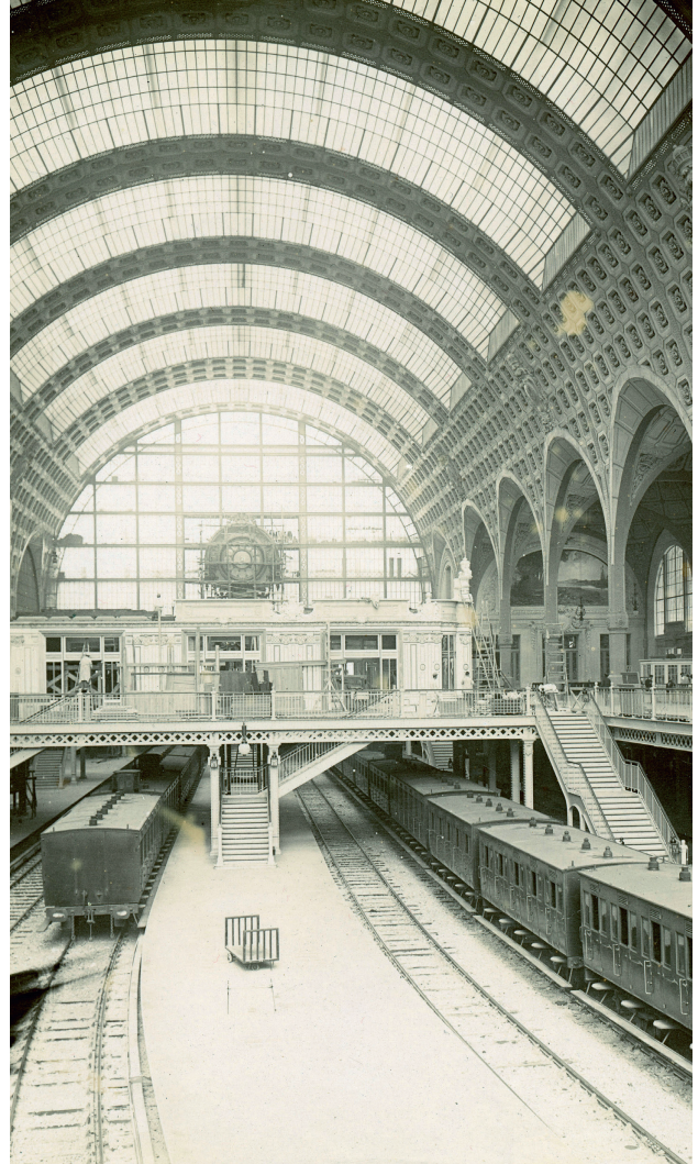
La gare d'Orsay.