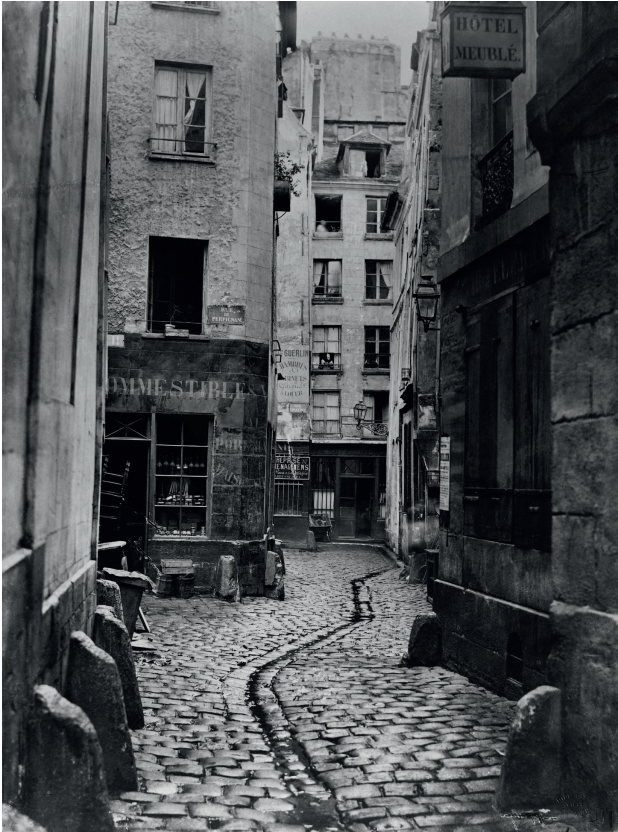
Rue des Trois-canettes, vers 1860.