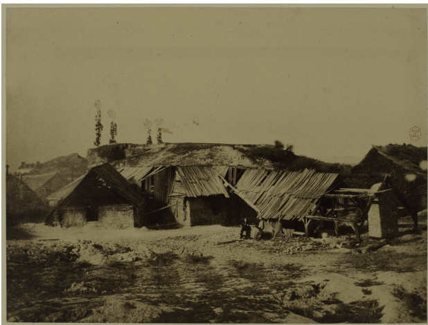
Terrain où sera aménagé le parc des Buttes-Chaumont, vers 1850.