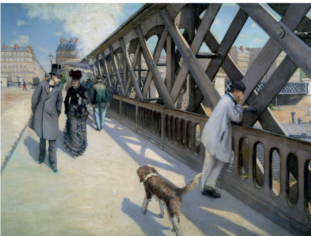
Gustave Caillebotte : Vue du Pont de l'Europe à Paris en 1876.