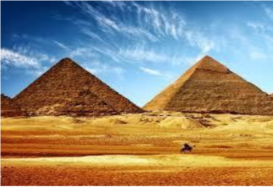
le désert de Nubie