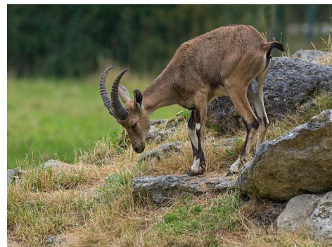
chat des sables bouquetins de Nubie