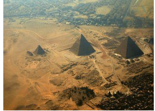
le plateau de Gizeh