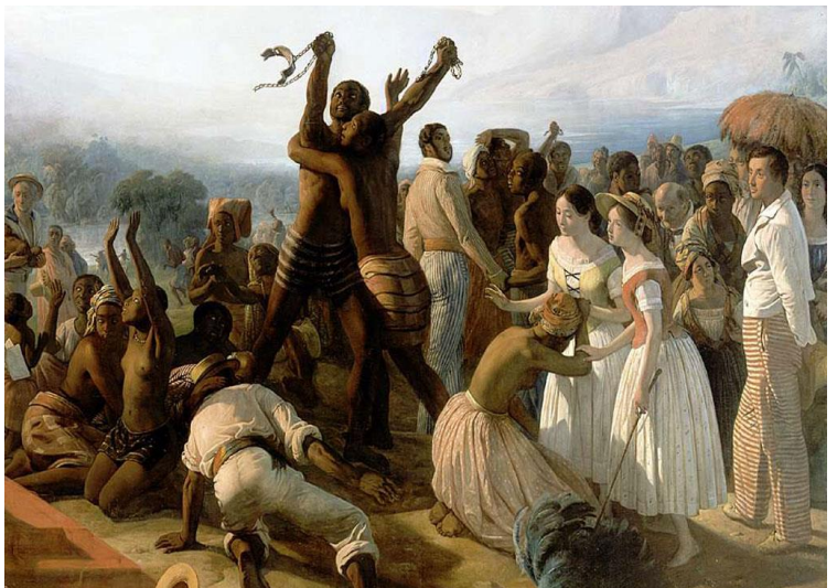
L'abolition de l'esclavage dans les colonies françaises en 1848

Devenus libres , les esclaves furent payés pour leur travail, comme les autres travailleurs, et purent choisir leur métier et leur mode de vie.