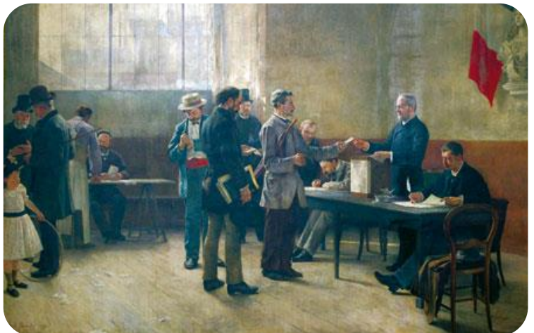
Bureau de vote (tableau de 1891)

En 1848 , sous la Seconde République, une loi a accordé le droit de vote à tous les hommes de plus de 21 ans : c'était le suffrage masculin .