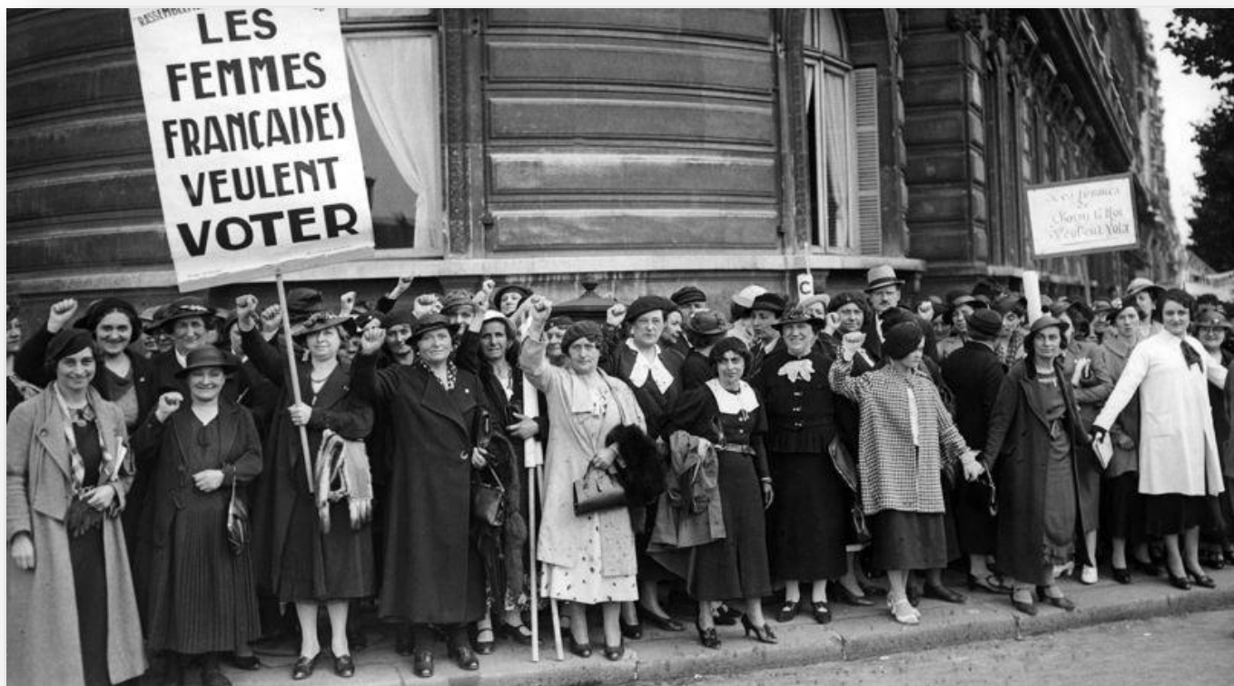
Manifestation de femmes françaises pour le droit de vote à Paris en 1936

Mais des inégalités continuent d'exister : il y a peu de femmes ministres, députés ou chefs d'entreprise . Les salaires des femmes restent inférieurs à ceux des hommes .