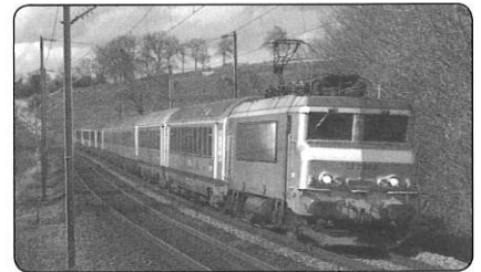
milieu du xx e siècle