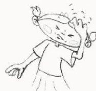
Le pou se nourrit de sang. Et cela gratte la tête.

La femelle pond 10 lentes par jour, soit 300 œufs dans sa vie de 8 semaines. Elle les pond à la base des cheveux à 3/5 mm du cuir chevelu.