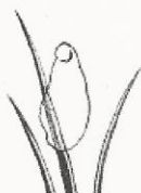
Le pou femelle pond des œufs. On les appelle des lentes.