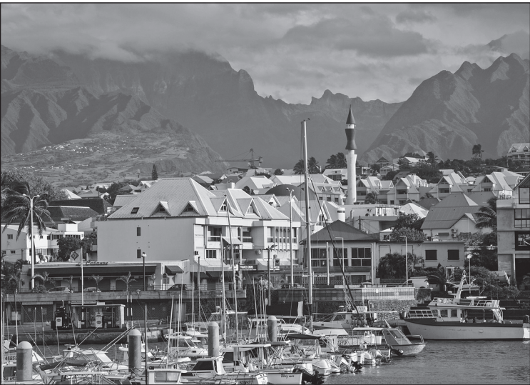
Doc. 3 Le port de Saint-Pierre.