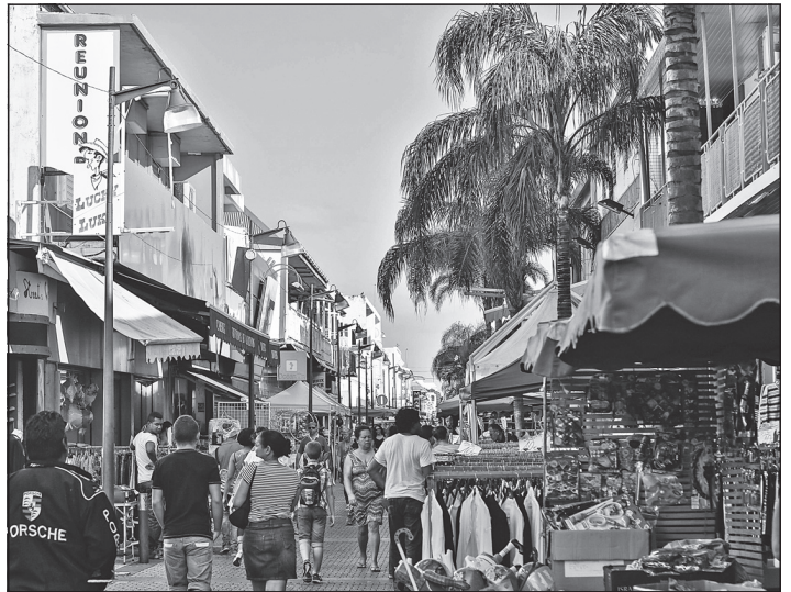
Doc. 4 Une rue commerçante de Saint-Pierre.

6. Décris le paysage de la ville en complétant le tableau.