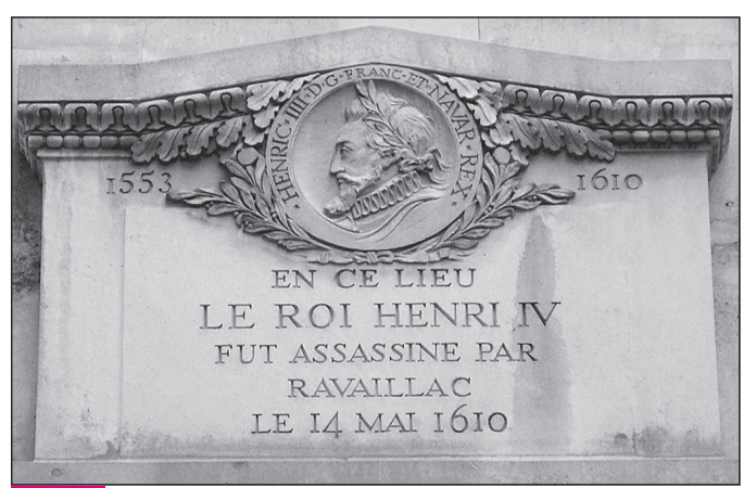
Doc. 5 Plaque de marbre ; 11, rue de la Ferronnerie à Paris.

8. À qui ce texte accorde-t-il des droits ?