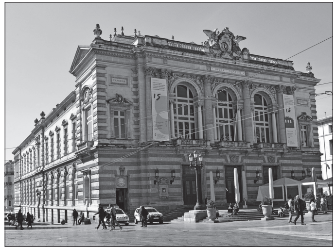
Doc. 2 Le théâtre municipal.