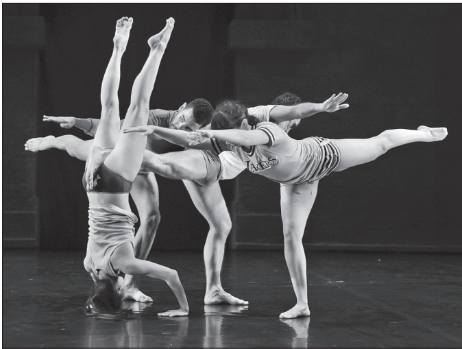
Doc. 1 Danseurs et danseuses, festival de danse.