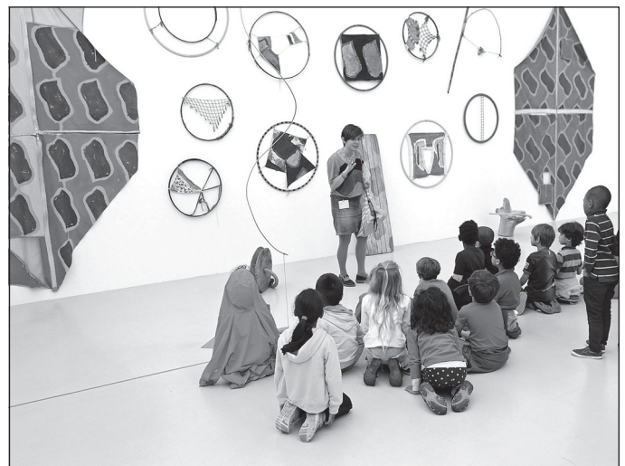
Doc. 4 Une exposition au musée Fabre.