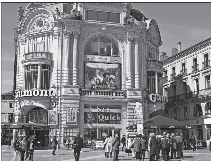
Doc. 3 Un cinéma.