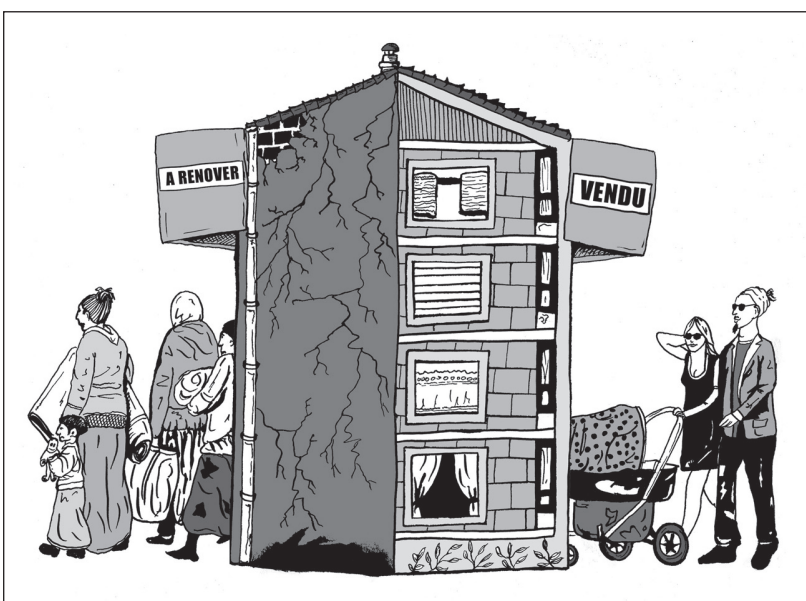
Doc. 6 La rénovation du quartier du Vieux-Lille, dessin LaFabrique.net

5. D'après le document 6, qui vivait dans les logements à rénover du Vieux-Lille ?