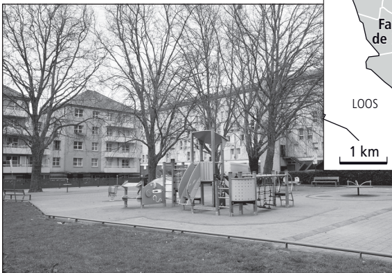
Doc. 3 Le quartier des Moulins, un quartier d'habitation à loyers modérés, en périphérie.