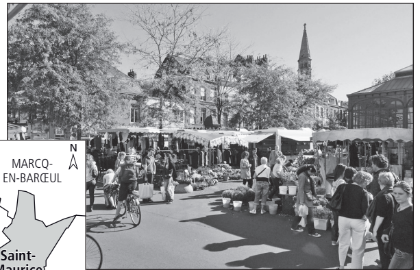
Doc. 2 Le quartier de Wazemmes, un quartier ancien et commerçant.