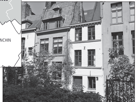
Doc. 4 Le quartier du Vieux-Lille, un quartier ancien avec des maisons individuelles.