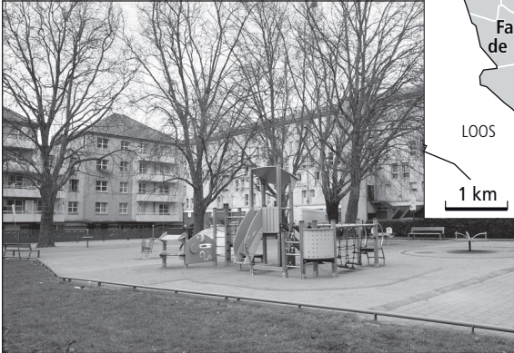
Doc. 3 Le quartier des Moulins, un quartier d'habitation à loyers modérés, en périphérie.