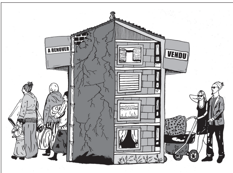
Doc. 6 La rénovation du quartier du Vieux-Lille, dessin LaFabrique.net

7. À ton avis, où les familles qui vivaient dans les logements à rénover ont-elles pu partir ?