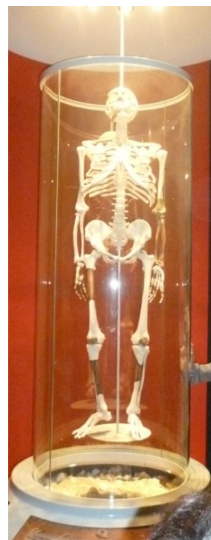
La reconstitution du squelette de Pierrette