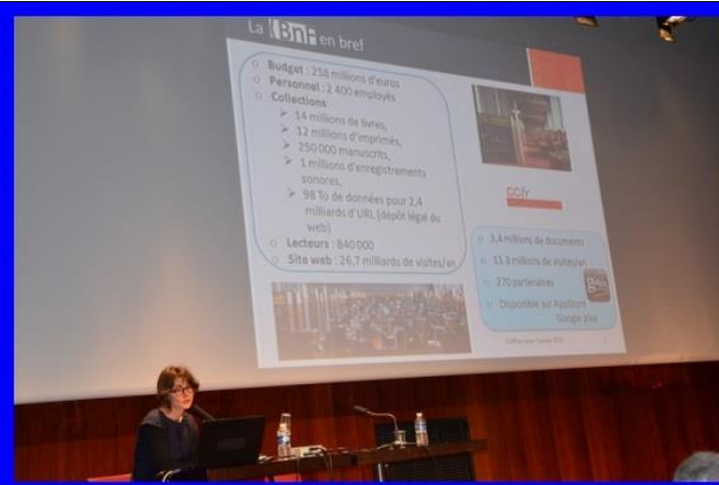
Site internet : http://gallica.bnf.fr/