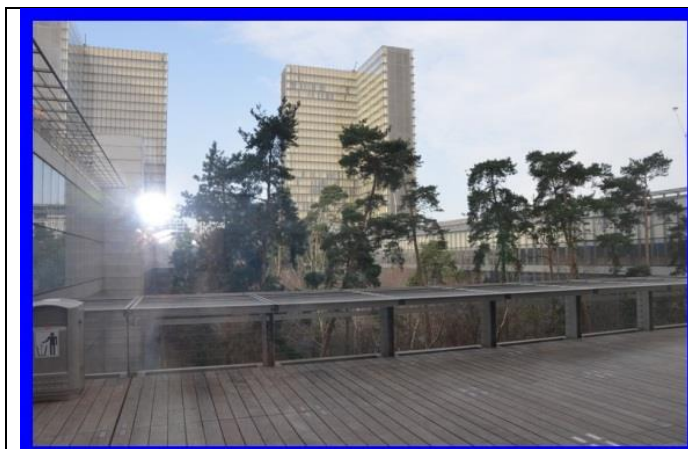
BnF, site François-Mitterrand, Paris 13 ème

Voici en images quelques moments de cette réunion qui s'est déroulée à la BnF, site François Mitterrand puis au Centre International d'Études Pédagogiques (CIEP) de Sèvres.