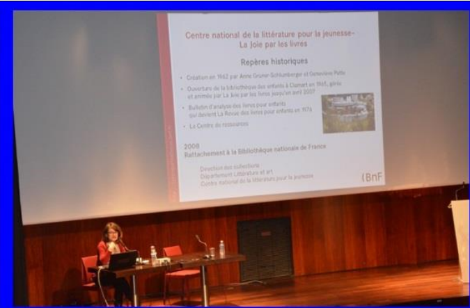
Sites internet pour la littérature de jeunesse http://enfants.bnf.fr/ http://lajoieparleslivres.bnf.fr/masc/Default.asp?INSTANCE=JOIE