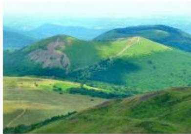
Le Massif Central