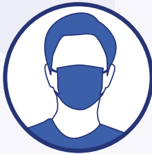
Port du masque obligatoire pour les élèves à partir du CP