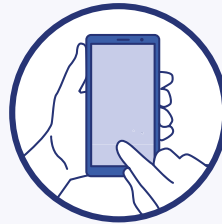
Utilisation des outils numériques (TousAntiCovid)

Numéro gratuit d'information sur le coronavirus : 0 800 130 000