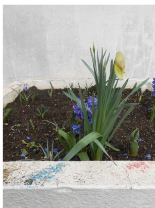
JONQUILLES (de la familles des narcisses)