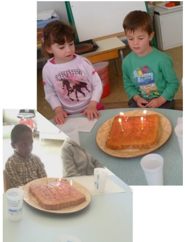
Très bon anniversaire à tous les 7 !