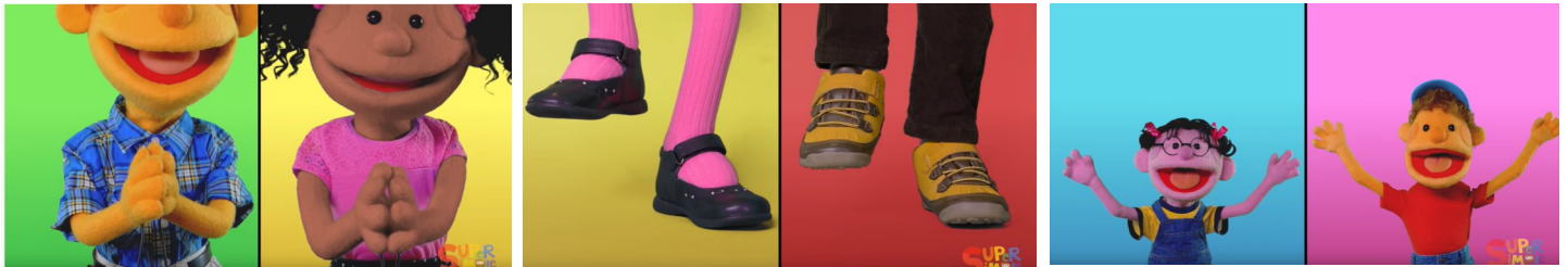
clap your hands

https://www.youtube.com/watch?v=M6LoRZsHMSs