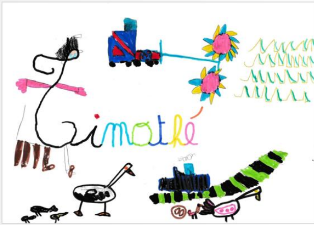
Dessin de Timothé à partir de sa majuscule.