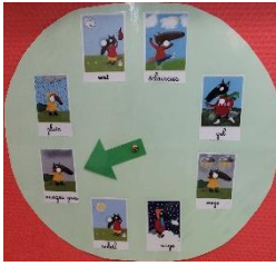
le livre de « loup »