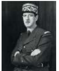
le Général de Gaulle