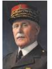
Le Maréchal Pétain