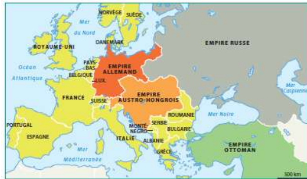
L'Europe en 1914

La carte de l'Europe a été bouleversée. Les pays du monde entier gardent encore le souvenir de cette Grande Guerre par le cinéma, les romans et les souvenirs de famille.