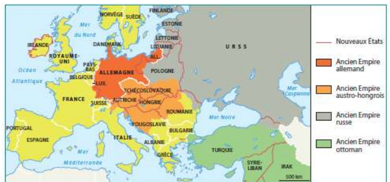
L'Europe en 1923

En France, tous les ans, on commémore la fin de la guerre, le 11 novembre. Dans chaque village on se recueille près des monuments aux morts. Le Président de la République allume la flamme de la tombe du Soldat Inconnu sous l'Arc du Triomphe à Paris.