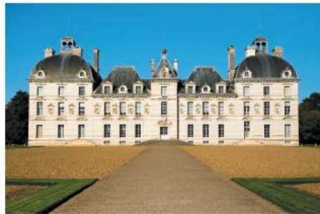
Château de Cheverny, France.