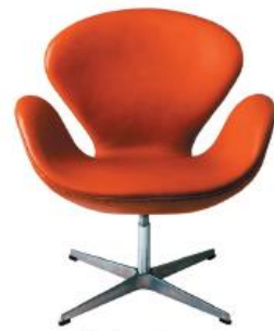
Chaise Swan, Arne Jacobsen.