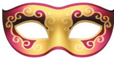
Masque de carnaval.

2. Trace l'axe ou les axes de symétrie de chaque image.