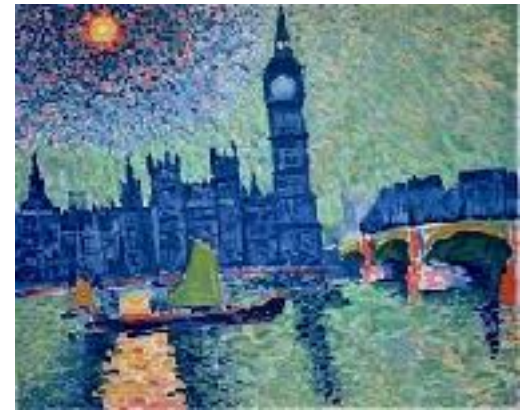
BIG BEN de André Derain