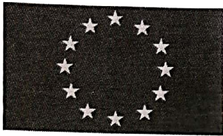
Le drapeau européen

*pays entouré par la mer de tous côtés sauf un.