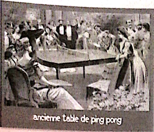
ancienne table de ping pong